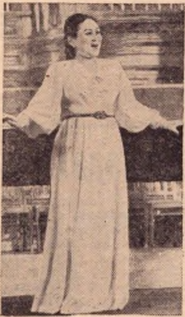
На снимке: народная артистка СССР лауреат Сталинской премии К. Байсеитова исполняет „Казахский вальс“ — музыка П. Хамиди, слова С. Муканова.